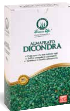
Scatola 250 gr