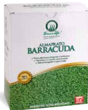
Scatola 500 gr