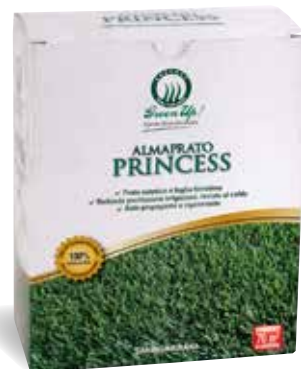
Scatola 500 gr