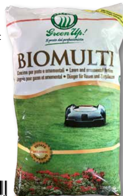
Sacco da 10 Kg