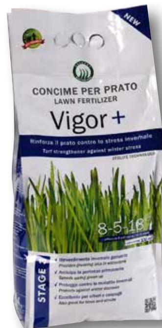
Sacco 4 kg