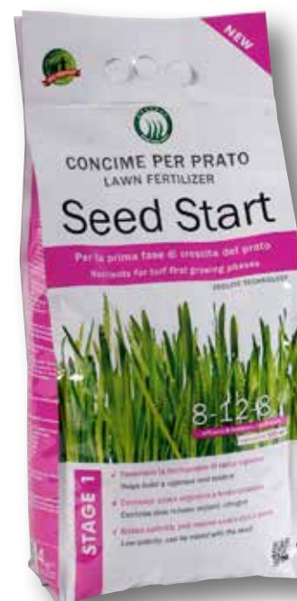
Sacco 4 kg