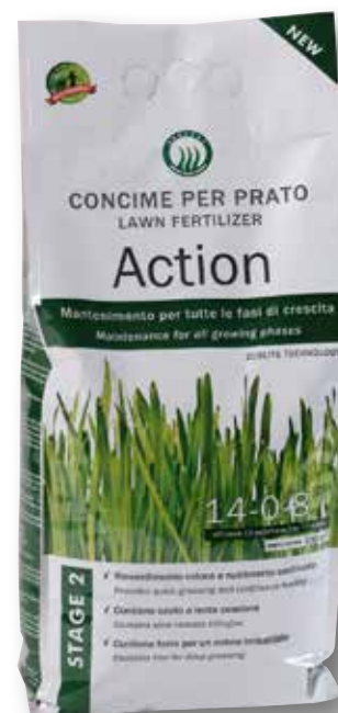
Sacco 4 kg