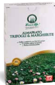
Scatola 250 gr