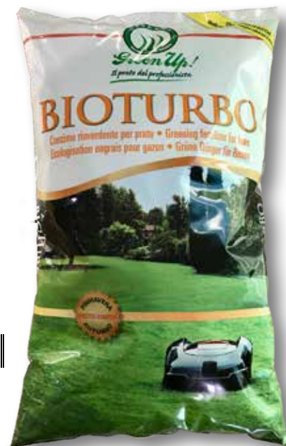
Sacco da 10 Kg