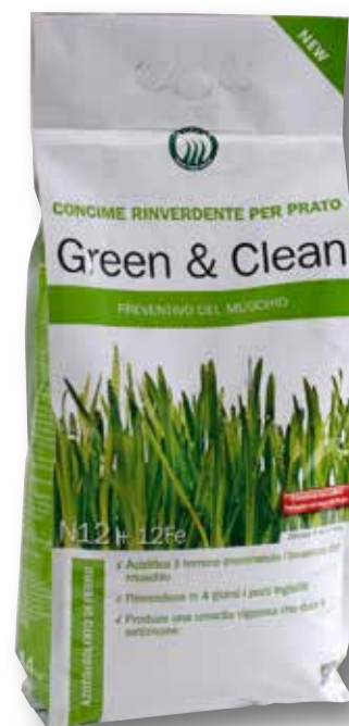
Sacco 4 kg